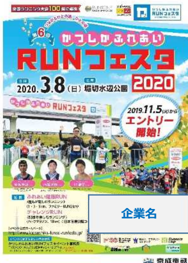
No.14 選手募集チラシ・ポスター